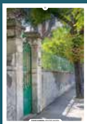
11 les clôtures

Chaque intervention sur les façades de nos centres anciens compte et participe à l'harmonie du paysage urbain. Au cœur de nos villes et villages, l'intérêt particulier et l'intérêt général doivent être conjugués pour créer le cadre de vie que nous y recherchons tous.