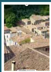
05 les toitures en tuiles rondes