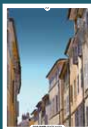
06 les débords de toiture