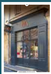
18 les devantures commerciales en applique