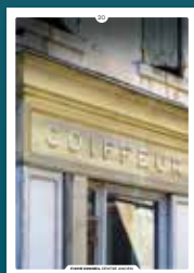
20 les enseignes

Chaque intervention sur les façades de nos centres anciens compte et participe à l'harmonie du paysage urbain. Au cœur de nos villes et villages, l'intérêt particulier et l'intérêt général doivent être conjugués pour créer le cadre de vie que nous y recherchons tous.