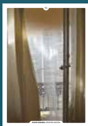
15 le confort thermique