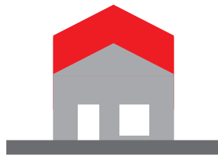
Surélévation d'une maison