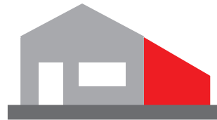
Extension d'une maison si le nouveau volume n'est pas accolé à l'existant, il s'agit d'une construction neuve*.