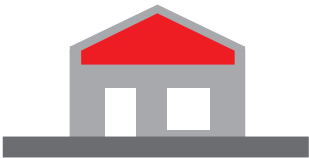
Aménagement de combles

Il s'agit de travaux sur constructions existantes : extension, surélévation, aménagement de combles ou de garage, etc. ces travaux sont soumis à Déclaration Préalable ou à Permis de Construire selon les surfaces du projet. Parfois, le recours à l'architecte est obligatoire. Cette fiche ne concerne pas les constructions à destination agricole.